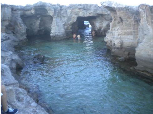
Piscine, Marina di Serra

16/07/2014- Bella passeggiata mattutina sulla strada poco trafficata del litorale salentino, poi visita al faro più alto d'Europa(alto 52mt) e all'attigua Basilica di S. Maria di Leuca. Nel pomeriggio andiamo più avanti al Ponte Ciolo. Riusciamo a trovare poco dopo del ponte, un buco non tanto ottimale per i nostri VR, scendiamo lo stesso, per delle fotografie di rito. Alla nostra vista l'anfratto, la spiaggetta, la scogliera, il mare era un qualcosa di fantastico. Vi erano in basso sulla spiaggetta ed in acqua diverse persone, e addirittura alcuni temerari che tuffavano dalla scogliera da un'altezza di circa 30/40 metri. Ci muoviamo nuovamente, direzione Nord. Da su in alto dalla scogliera intravediamo un parcheggio che potrebbe essere confacente alle nostre esigenze, quindi cerchiamo la strada e scendiamo giù. La località è Marina di Serra e l'area sosta è alla fine del lungomare, non vi sono divieti, ci fermiamo anche per pernottare (N 39.909355-E18.391759).