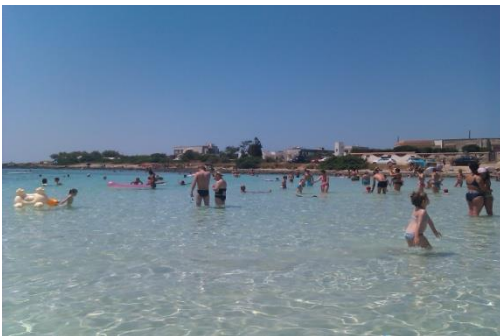
Spiaggia di Punta Prosciutto

06/07/2014- Si va in S. Pietro in Bevagna AA "La Marina", al costo di 18,00 euro con corrente. La spiaggia è un po' affollata di bagnanti, in compenso sfocia un fiumiciattolo di acqua gelata limpida. Il paese è bellino, con un discreto movimento, in serata né approfittiamo per una passeggiata e un bel gelato.